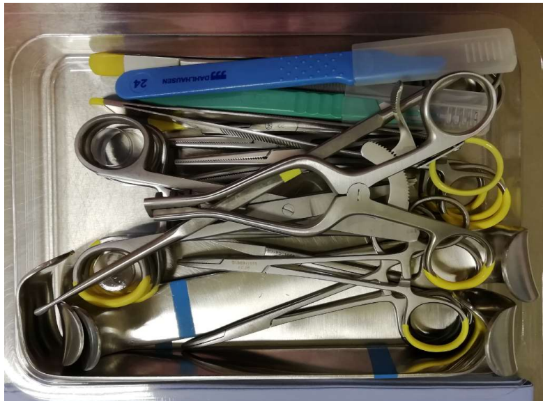
Abbildung / Figure Set 5017680